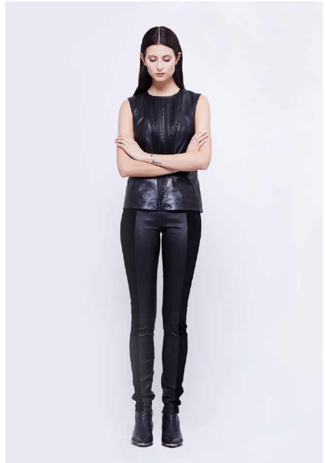
Top ANOUK Trousers CLÉMENCE