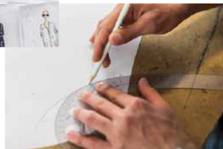
The atelier team experiments with different kinds of fabrics during the design process.