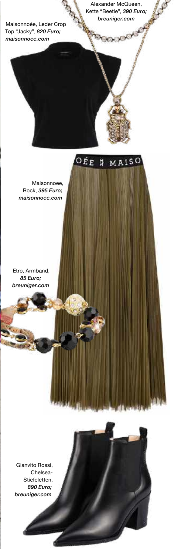
Maisonnoée, Leder Crop Top "Jacky", 820 Euro; maisonnoee.com