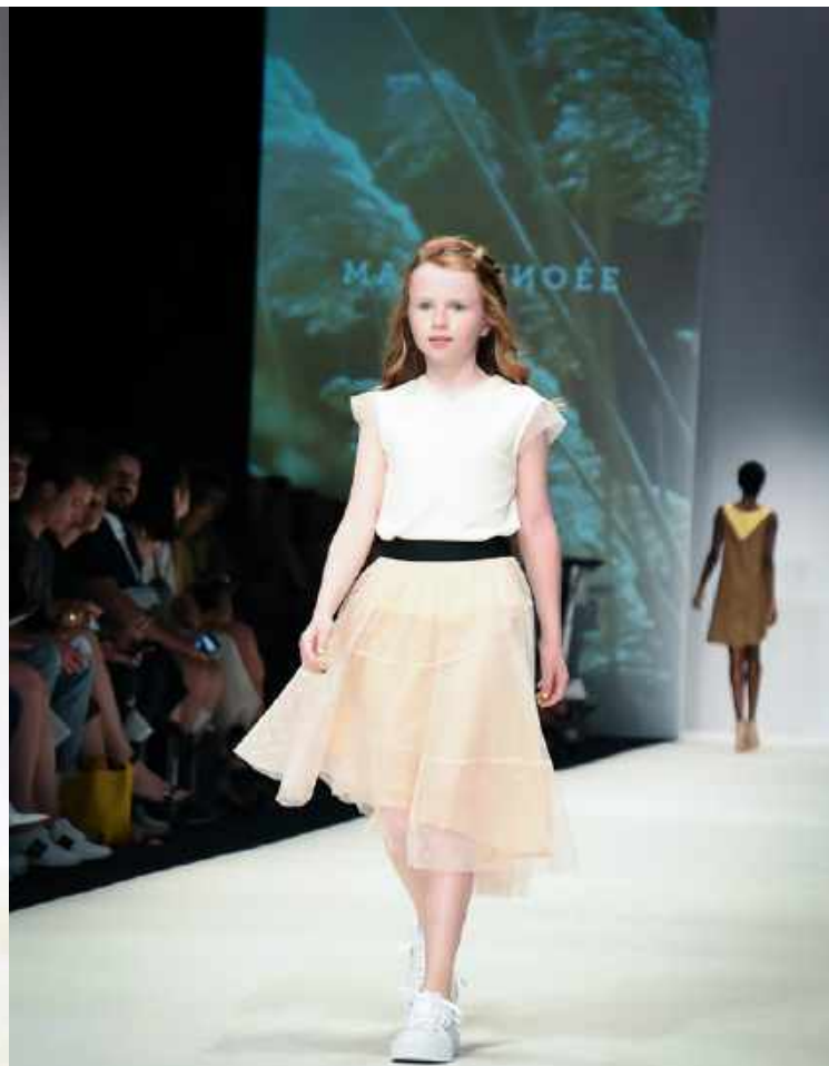
Skirt Triangle, 180 Euro, Top Tulle, 120 Euro