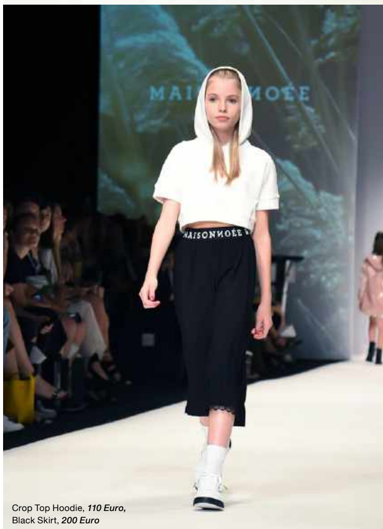
Crop Top Hoodie, 110 Euro, Black Skirt, 200 Euro