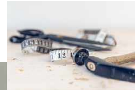
Moderne Arbeitstechniken werden mit traditioneller Handwerkskunst kombiniert.