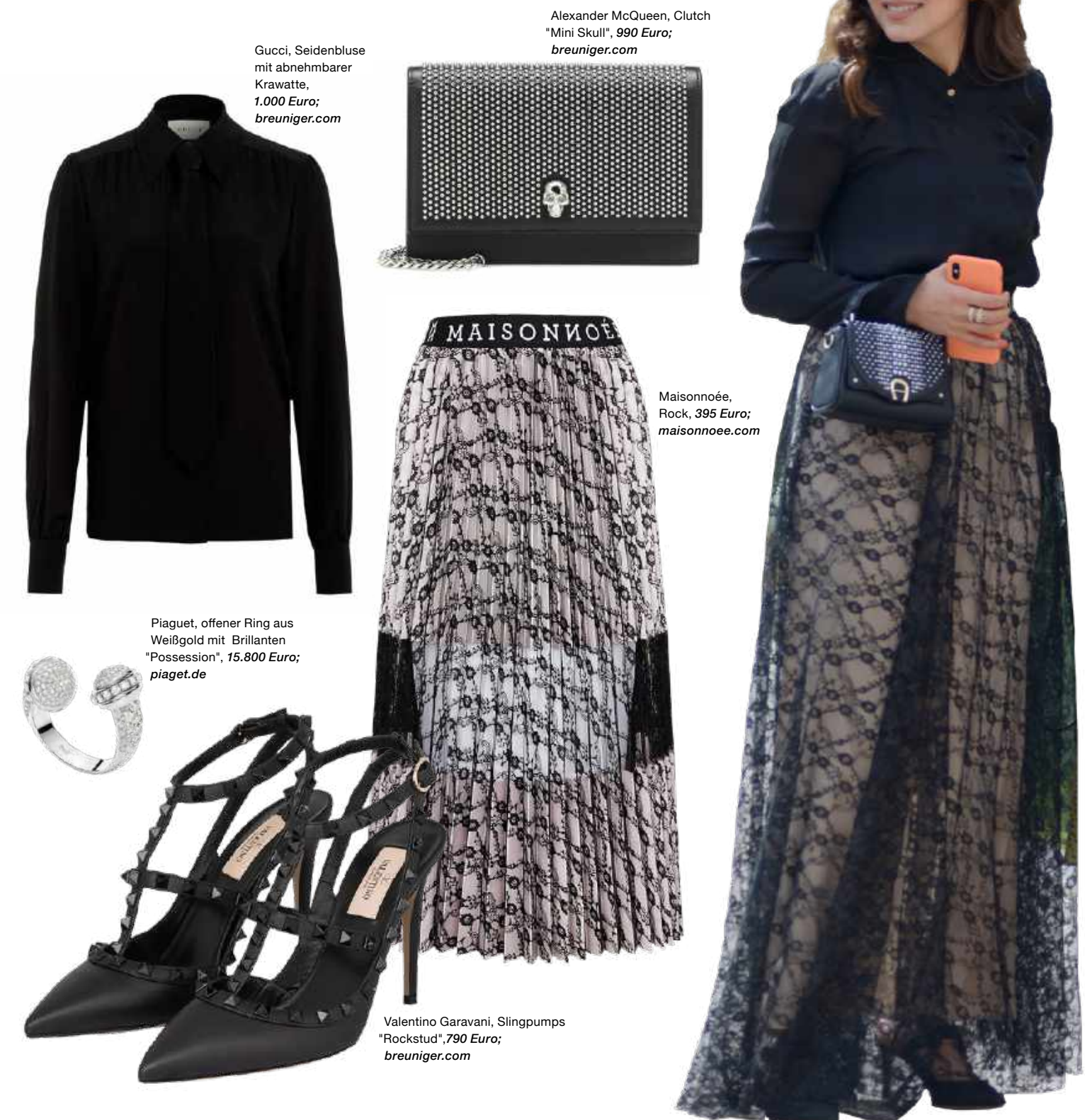
Gucci, Seidenbluse mit abnehmbarer Krawatte, 1.000 Euro; breuniger.com