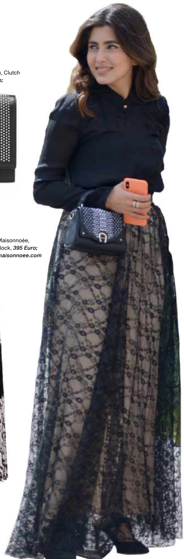
Valentino Garavani, Slingpumps "Rockstud", 790 Euro; breuniger.com