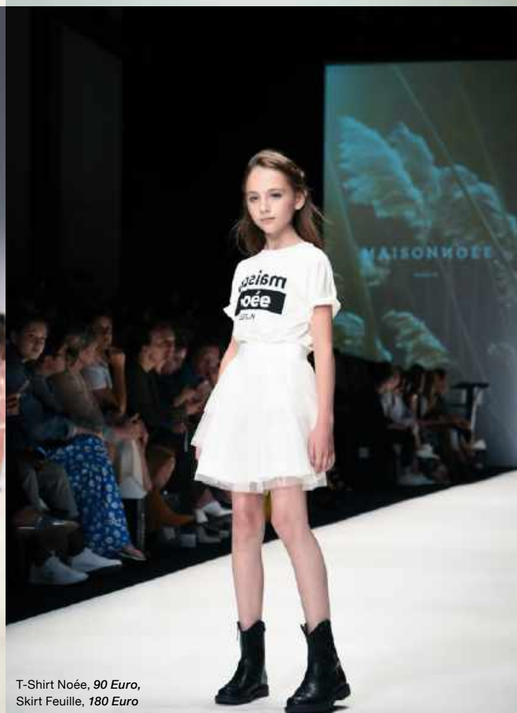
T-Shirt Noée, 90 Euro, Skirt Feuille, 180 Euro