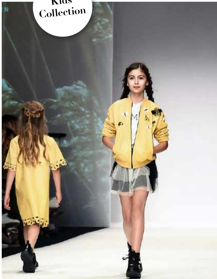
Skirt Jellyfish, 210 Euro, Leather Bomber Bee 800 Euro, #IAMMN T-Shirt 99 Euro