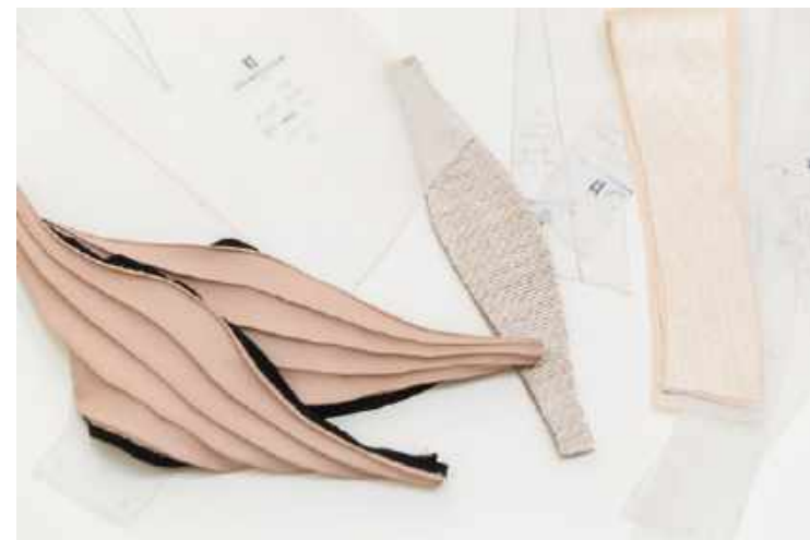
Während des Designprozesses wird mit verschiedensten Stoffproben experimentiert.

Every single garment starts with the design, at first only a rough idea, a shape or a mood, transferred to paper where the journey of each piece starts and ends – the in-house atelier. After researching current trends and collecting ideas from journeys, nature and art, designer Sophie Oemus starts off by creating mood boards and first drawings. Marking the beginning of every new collection, these drawings determine the general direction the designer is aiming for. They are part of the initial creative