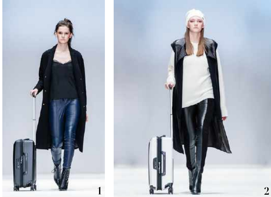
1 Hochwertiger Hartschalenkoffer "Thule Revolve Widebody On Spinner", 424,95 Euro 2 Hochwertiger Hartschalenkoffer "Thule Revolve Widebody On Spinner", Limited Edition Weiß, 499,95 Euro